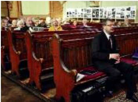
Gottesdienst „25 Jahre Friedliche Revolution“ am 2. November in der Trinitatiskirche

Im Namen des Redaktionskreises Ihr Gunter Odrich