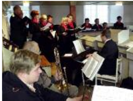
Der Gröbaer Chor singt zum Reformationsgottesdienst in der Kirche Gröba.