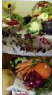
Erntedankfest 2014 in der Kirche Weida