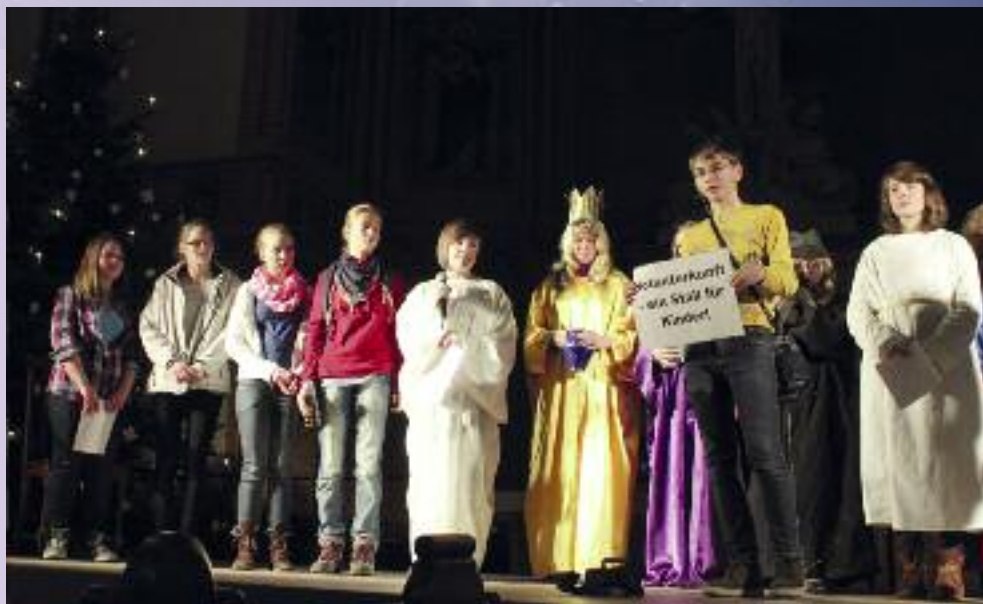
Krippenspiel der Konfirmanden 2013